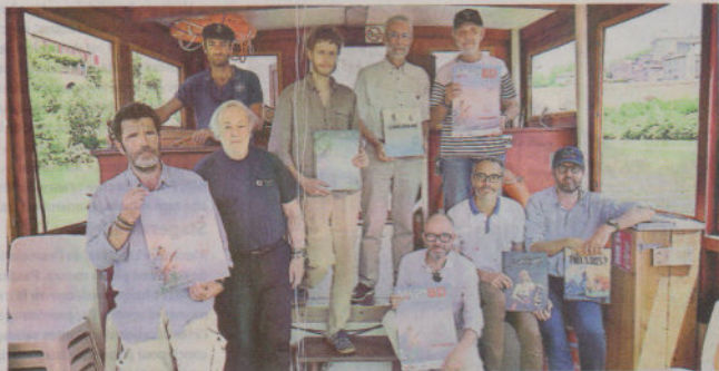
L'équipe qui propose ce salon de la BD autour de Lapérouse.