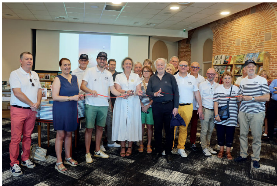
Inauguration du salon par Madame la maire