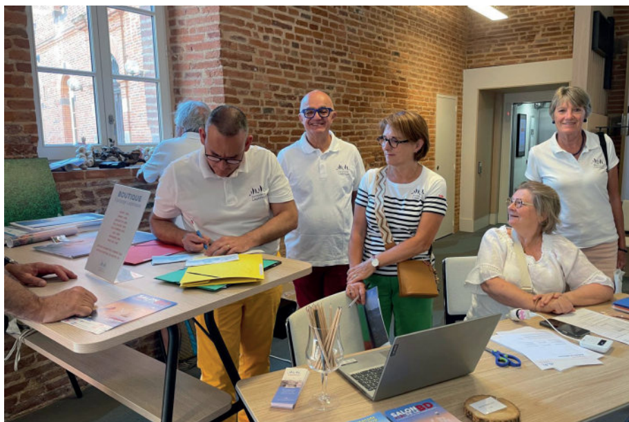
Association Équipage Lapérouse